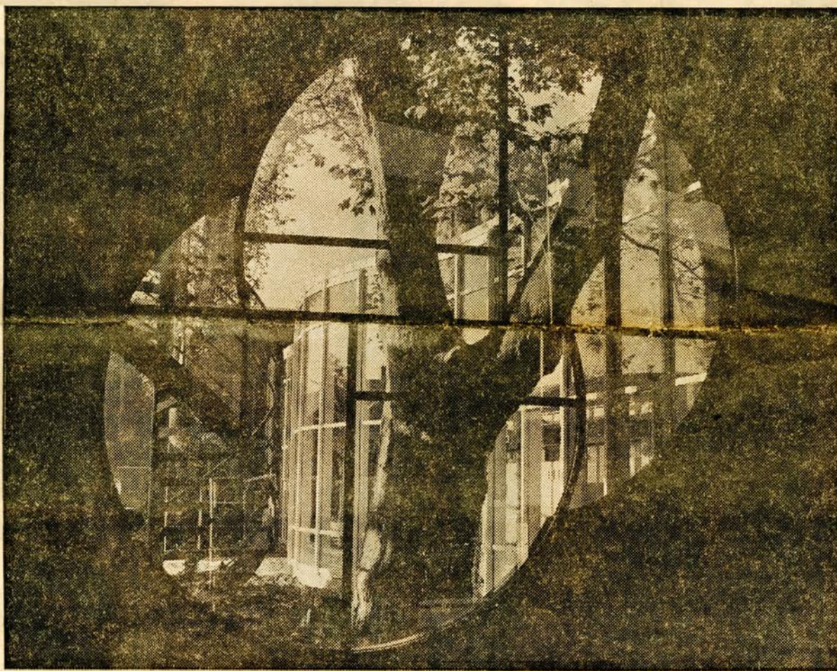
● Een bijzonder gevormd venster in een ruw betonnen wand biedt zicht op twee monumentale platanen.

Kalfsbeek als we voor de nieuwbouw van het Energiebedrijf staan. "Ik wil mijn eigen verhaal vertellen. Daarbij heb ik altijd respect voor de omgeving. Is mijn buur een monumentaal pand als dat van Mulock Houwer, dan kijk ik naar de karakteristieken, neem de belangrijkste bewegingen ervan over. Maar ook de nietszeggende nieuwbouw aan de andere kant is een belangrijk gegeven. Ruimtelijke samenhang vind ik heel belangrijk."